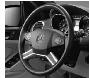
Multifunktionslenkrad in Leder-/Holzausführung