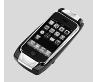
Aufnahmeschale für Apple iPhone