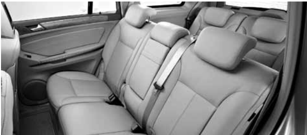
Polsterung Leder Nappa