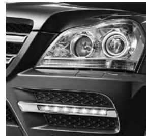
Intelligent Light System mit Bi-Xenon-Scheinwerfer