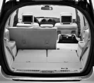
Fondsitzbank 1/3 : 2/3 klappbar