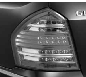
Heckleuchten mit LED-Technik