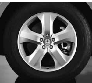
5-Speichen-Design (Code 21R)