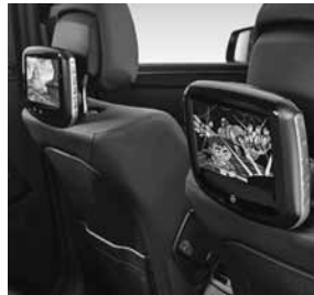
Fond Entertainment System Kit