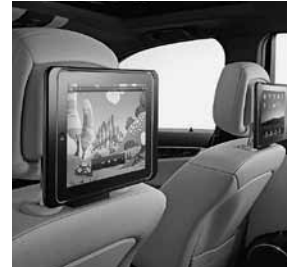
Apple iPad 2® Fond-Integration Plus