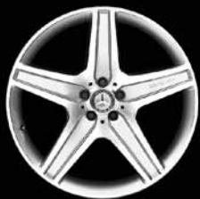
AMG 5-Speichen-Design (777)