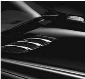
Finnenaufsätze für Motorhaube