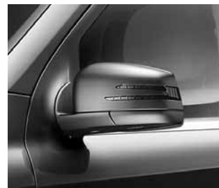
Außenspiegel mit Blinkleuchte