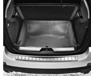
Staufach unter Laderaum

Getriebe-Automatik 7G-TRONIC PLUS mit Ganganzeige im Cockpit (für GL 350 CDI 4MATIC BlueEFFICIENCY)