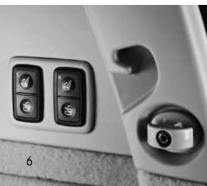
3. Sitzreihe elektrisch klappbar