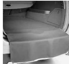
Wendematte mit Ladekantenschutz