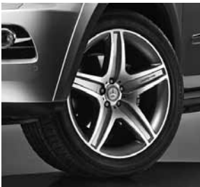
AMG 5-Speichen-Design (Code 777) mit Kotflügelverbreiterung