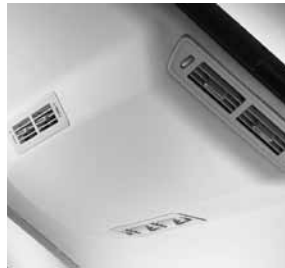
Klimaanlage im Fond