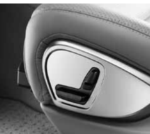
Vordersitze elektrisch verstellbar