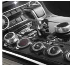
AMG DRIVE UNIT mit E-SELECT Wählhebel