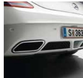
Heckstoßfänger mit Endrohrblenden