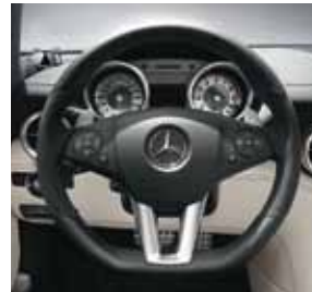
AMG Performance Lenkrad