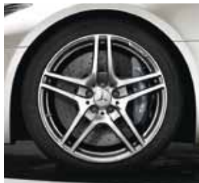
5-Doppelspeichen-Design, Code 764