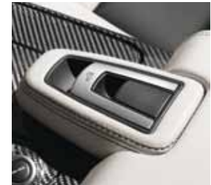
Dachbedieneinheit in der Mittelarmlehne