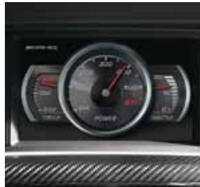
AMG Performance Media