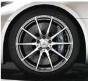
10-Speichen-Design, Code 766