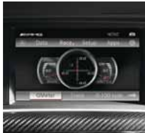
AMG Performance Media