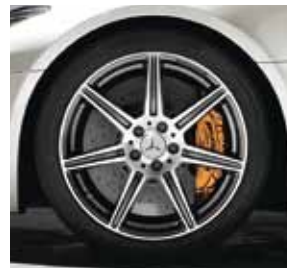
7-Speichen-Design, Code 765