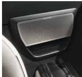
Subwoofer Bang & Olufsen BeoSound AMG