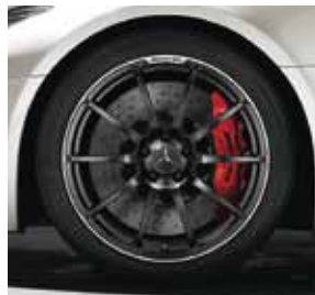
10-Speichen-Design Code 767