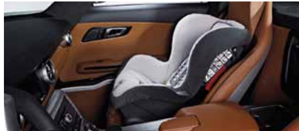
Kindersitz DUO plus