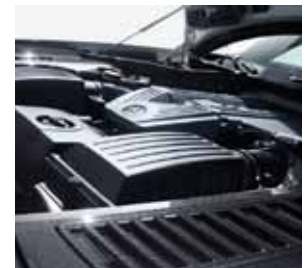
AMG Carbon Motorraumabdeckung