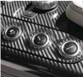
AMG RIDE CONTROL Sportfahrwerk