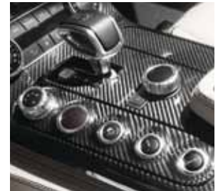
AMG Zierelemente Carbon