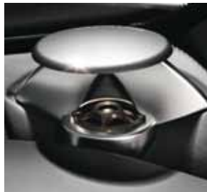
Hochtöner Bang & Olufsen BeoSound AMG