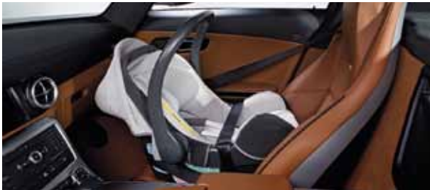
Kindersitz BabySafe plus