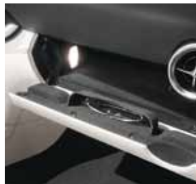
Brillenfach im Handschuhfach