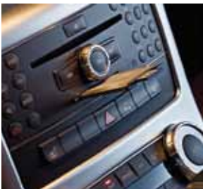
PCMCIA Multi-Card Reader mit SD-Karte