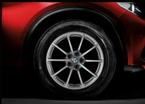
17" 10-Speichen, Leichtmetallfelge dunkel