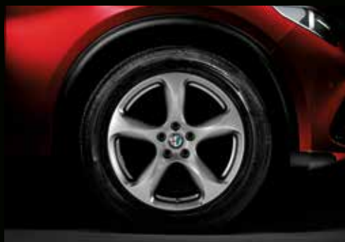
18" 5-Speichen, Leichtmetallfelge dunkel