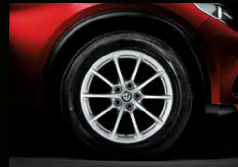
19" 10-Speichen, Leichtmetallfelge