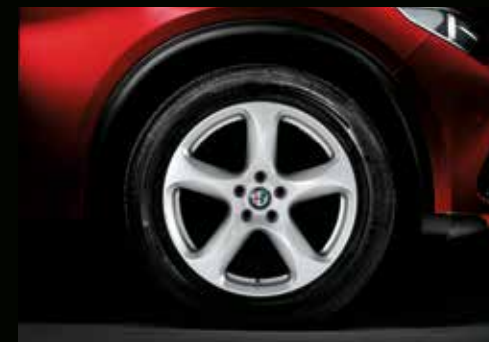
18" 5-Speichen, Leichtmetallfelge