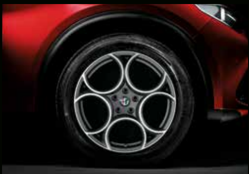
19" 5-Loch, Leichtmetallfelge