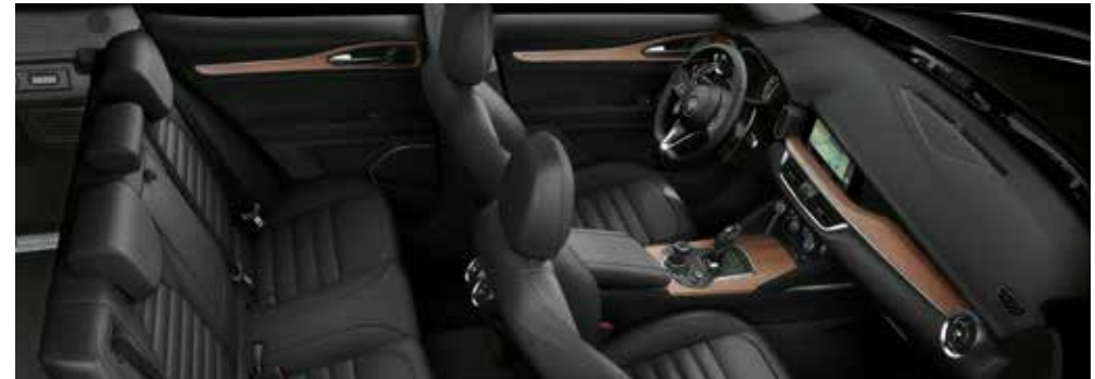
Lusso Paket Walnußholz