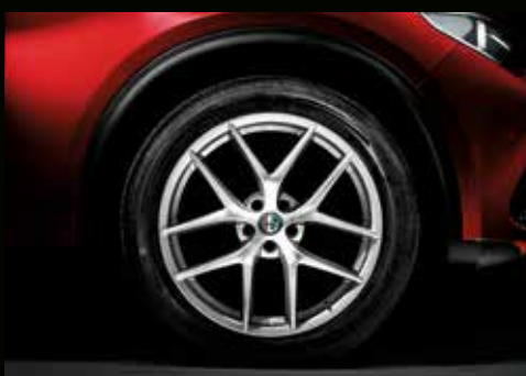
20" 10-Speichen, Leichtmetallfelge