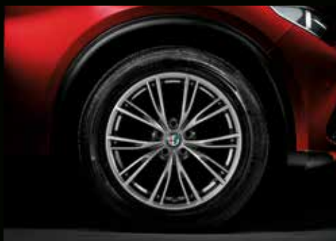
18" Leichtmetallfelge Lusso