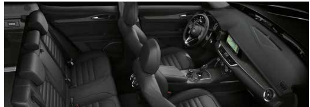
Lusso Paket Eichenholz