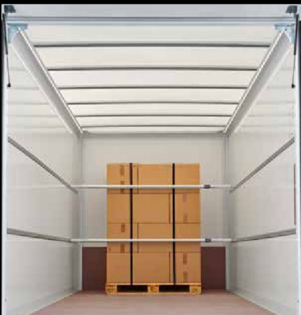
Optional: Sperrstange und Airline-Schiene