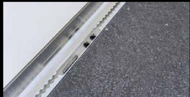
Serienausstattung: Umlaufende Aluminium-Sockelscheuerleiste mit integriertem Airlineprofil