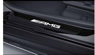
AMG Wechselcover für beleuchtete Einstiegsleiste, vorne, 2-fach