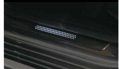
Wechselcover für beleuchtete Einstiegsleiste, vorne, 2-fach