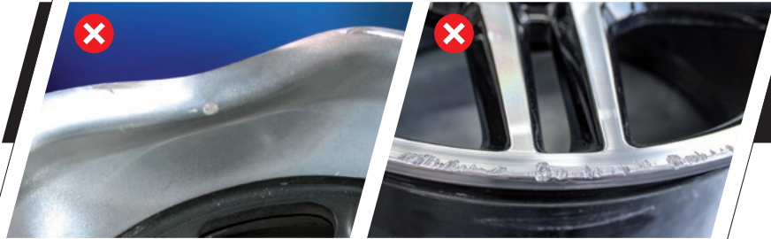
Zu starke Verformungen durch massive Außeneinwirkung