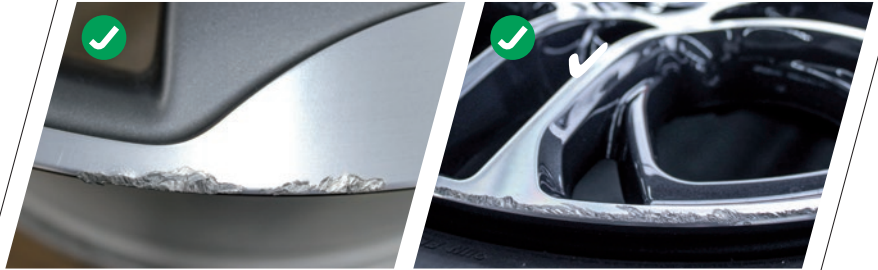
Beispiele für mögliche Instandsetzungen

Selbstverständlich werden bei der Felgenreparatur die jeweiligen Herstellerangaben berücksichtigt.